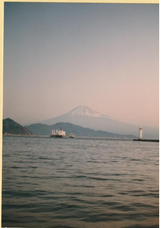
0101 日の出前 (三保)