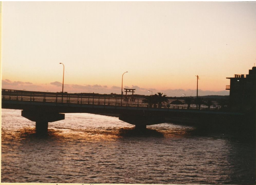
0101 浜名湖村. 夕景.